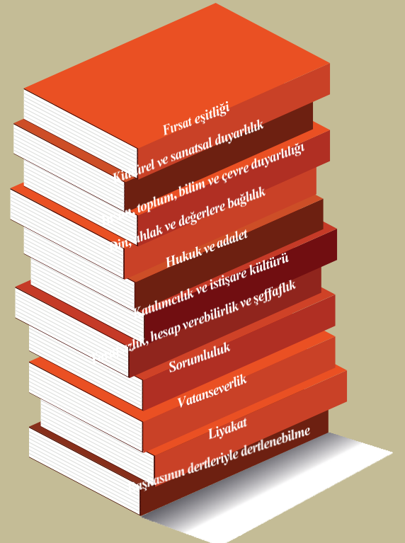
Şekil 15: Temel Değerlerimiz